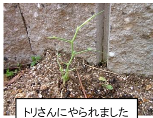
トリさんにやられました