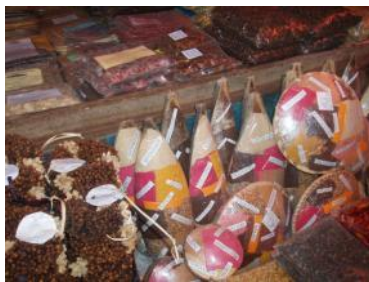
ザンジバルのマーケット