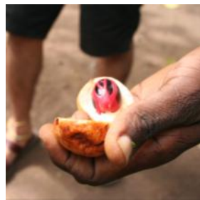
色鮮やかなナツメグの実