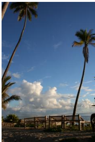
ザンジバルのリゾート