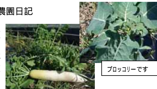
ブロッコリーです

里芋は夏の時期に水を必要とするらしく、水やりが足りなかったのがあまり大きくなりませんでした。もう寒くなってきたので来月にはジャガイモも掘っていきます